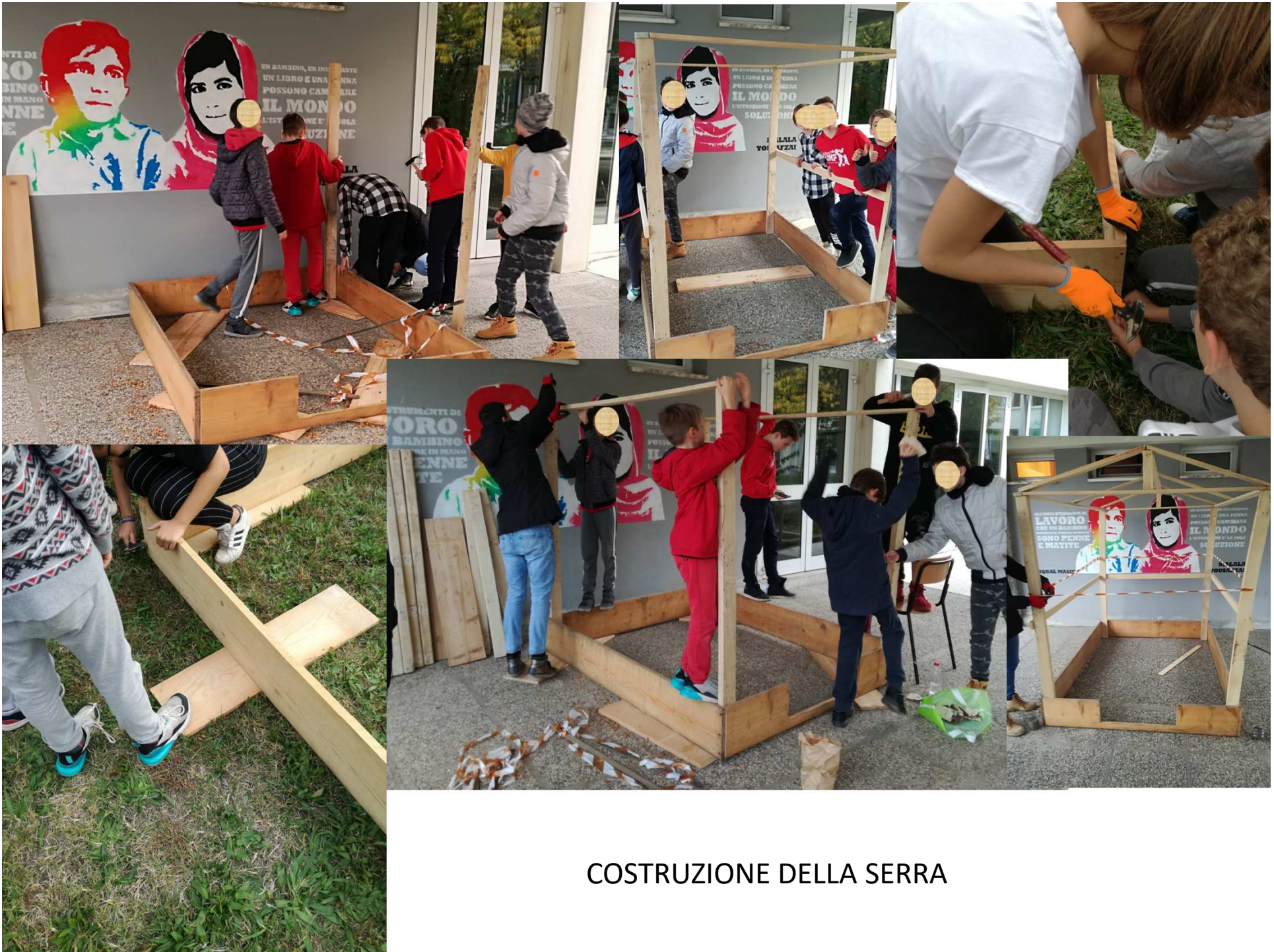
COSTRUZIONE DELLA SERRA