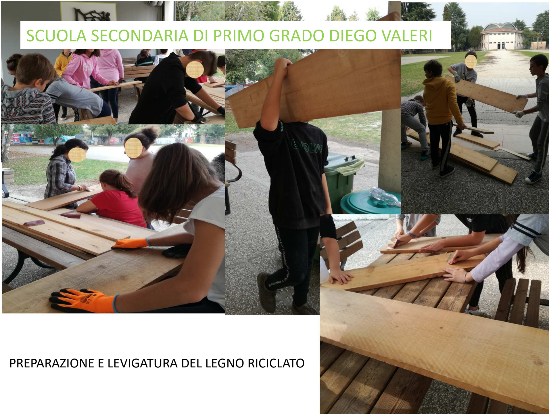
PREPARAZIONE E LEVIGATURA DEL LEGNO RICICLATO